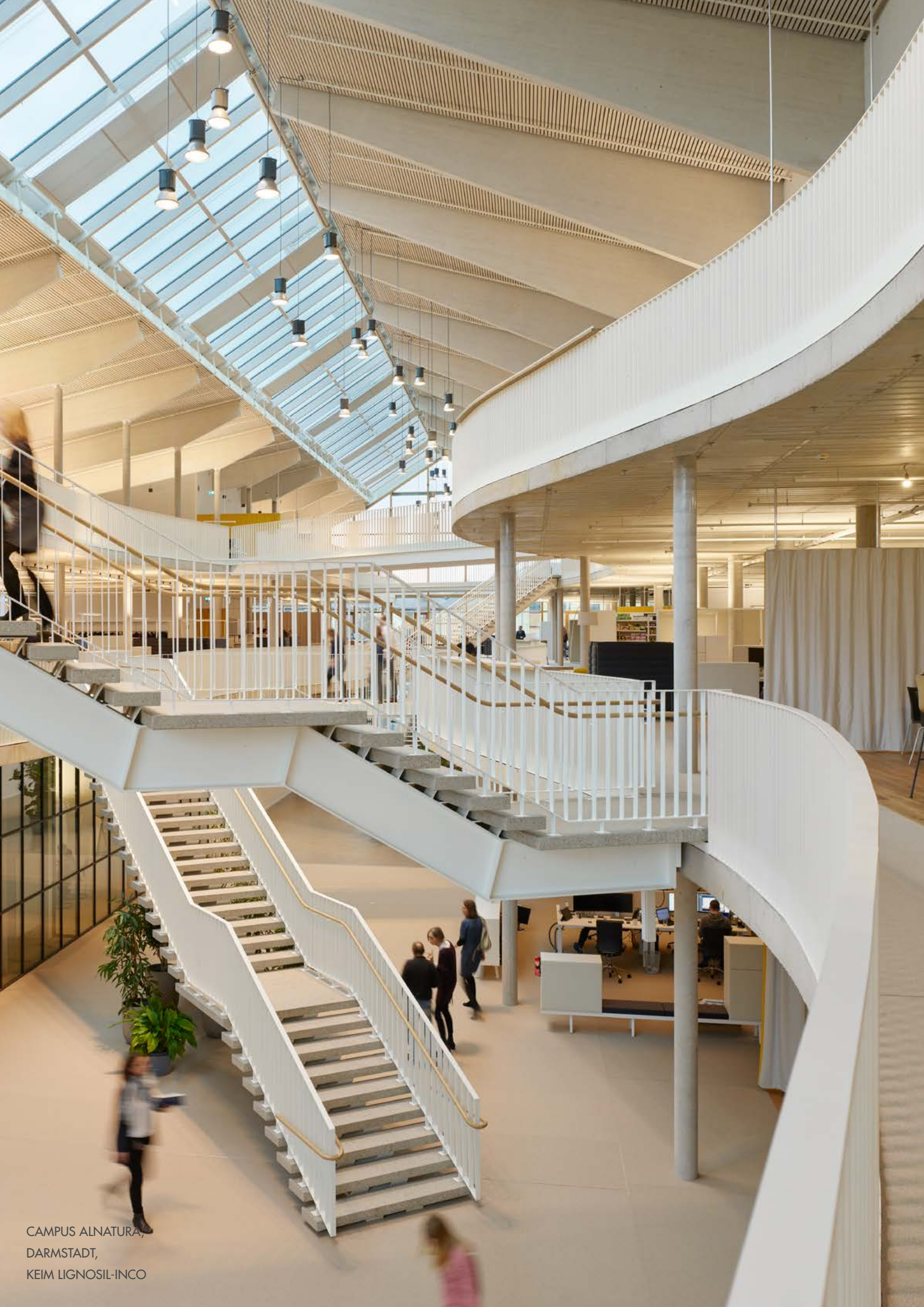
CAMPUS ALNATURA, DARMSTADT, KEIM LIGNOSIL-INCO